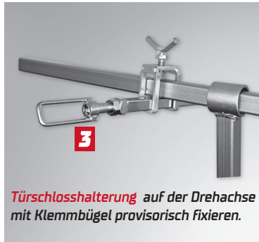
Türschlosshalterung auf der Drehachse mit Klemmbügel provisorisch fixieren.